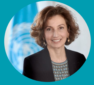
Audrey Azoulay, Directora-General de UNESCO

«En este día, recordemos que los pueblos indígenas son agentes del cambio, guardianes de los recursos naturales y portadores de cosmovisiones, conocimientos y habilidades únicas. Debemos proteger sus tradiciones y formas de vida, respetando al mismo tiempo sus derechos».